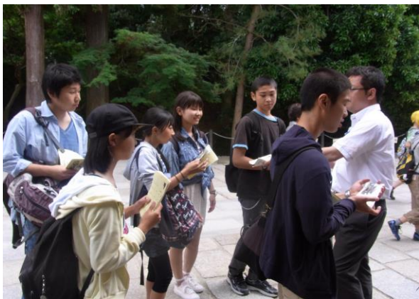
奈良公園班別自主行動中の生徒

2年生の時から準備してきた修学旅行でしたが、あっという間の三日間でした。それほどに、とても充実した時間を過ごし、黄色学年全員が輪をつないで楽しむことができましたと思います。 事前学習では、一人ひとりが係の仕事に責任を持って取り組み、自分たちの修学旅行を成功させようと務めました。ルール決めでは、みんなが守れるものになるようしっかり話し合っていました。仲間がみんなの立場になって考えたものだからこそ“守ろう”という思いが強まったのではないかと思います。 いざ、京都・奈良へ行ってみると、横浜では味わえない古風な町並みや教科書で見た建築物など、たくさんの日本の文化や歴史を存分に感じることができました。また、班別自主行動では時間をしっかりと意識して全班が無事に帰ってくることができました。自然教室や鎌倉遠足の学習の積み重ねが発揮できたと思います。クラス別行動では扇子や和菓子作りを体験したり、学業成就や厄除けをしてもらったりと楽しい思い出となりました。初めての座禅体験では、心を空にして臨み、気持ちがすっきりとしました。 この三日間は、自分だけでなくみんなが楽しめるように助け合うことや仲間を思いやって行動することを大切にして最高の思い出をつくることができました。支えてくれた人への感謝の気持ちを忘れず、残りの日々を過ごしていきたいと思います。