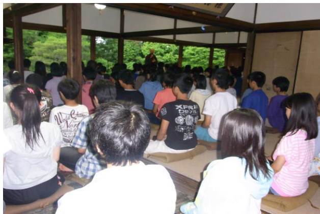
京都妙心寺住職の法話に神妙に聞き入る生徒