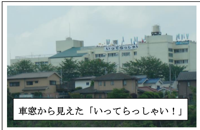
車窓から見えた「行ってらっしゃい!」

この旅行でつくりあげた、最高の学年の団結力を体育祭で十分に発揮してください。1・2年生をまとめ全力プレーで「西谷伝説」を見てもらえたでしょうか。